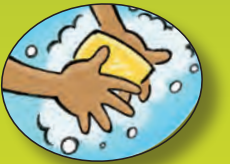
Lavarse las manos

Tener hábitos saludables te ayuda a evitar exponerte a los microorganismos que pueden hacerte sentir enfermo.