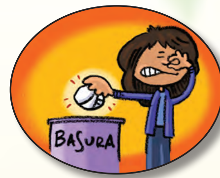
No permitas que entren heces a las fuentes de agua. Por ejemplo, desecha los pañales sucios en el tacho de basura.