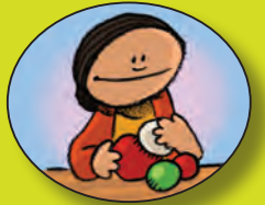
Lavar las frutas y verduras con agua limpia