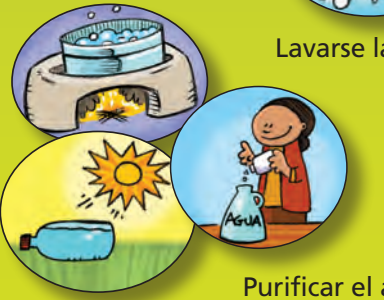
Purificar el agua

Mantener la casa limpia, especialmente la cocina