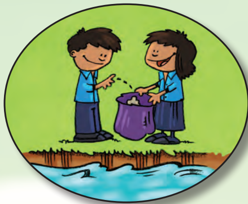
Limpia la basura alrededor de un río.