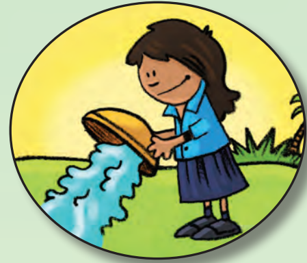
Desecha el agua sucia del enjuague lejos de las fuentes de agua.