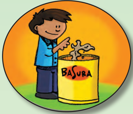
Arroja la basura en tachos de basura.

Había otra vez un ambiente de agua limpia.