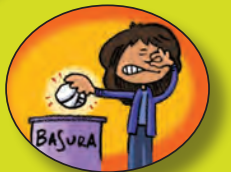
Desechar los pañales usados en tachos de basura; no permitir que entren heces a las fuentes de agua